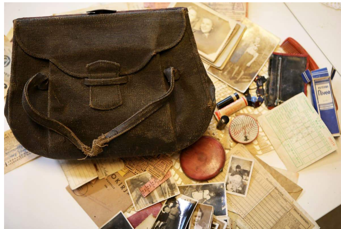
Handväskan som försvann 1946 innehöll många olika saker. I den grå väskan av pappersband fanns bland annat en kam, en puderdosa, två läppstift, ett armband, några foton och flera dans- och bröllopsinbjudningar. Dessutom innehöll den viktiga dokument som identitetskort, skattekort, medlemsbok till beklädnadsarbetarnas förbund, ransoneringskort och en gammal stryktipskupong.

Tänk dig att din skolväska försvinner idag. Kanske glömmer du den i skolan, eller i någon hobbylokal. Skriv en berättelse som handlar om att din skolväska hittas om 70 år. Beskriv var, hur och när den hittas. Vem är det som hittar den? Vilka saker hittar hen i din väska och i vilket skick är de? Vad tänker upphittaren att sakerna ska användas till (eller att de har använts till)? Vilket värde har föremålen om 70 år? Hur mycket är föremålen värda i pengar, och hur användbara är de? Sätt er i grupper och läs upp era texter, eller valda delar av dem, för varandra. Ni kan också välja att fritt återberätta det ni skrivit i stället för att läsa upp det.