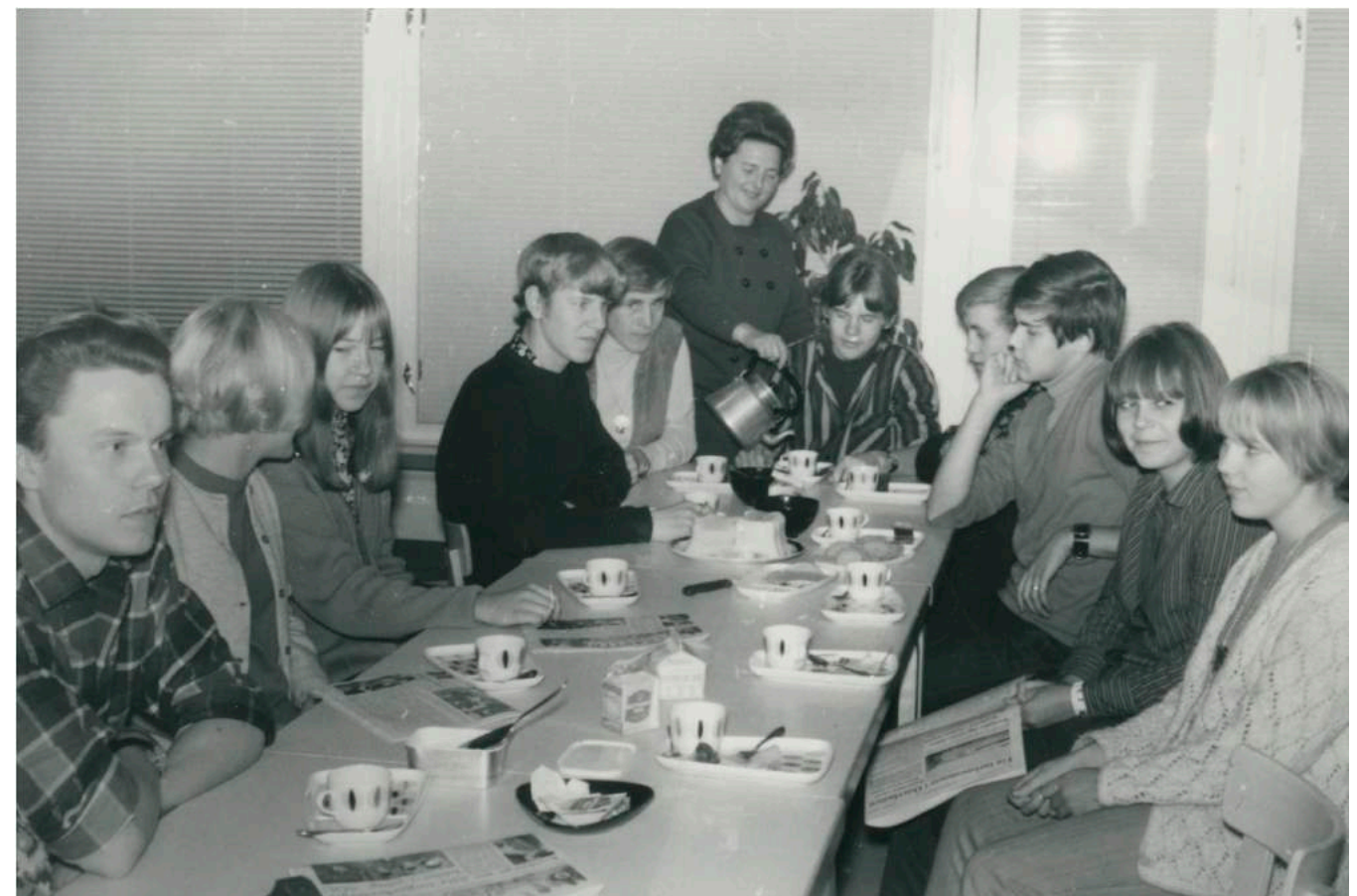
Möten är en viktig del av föreningslivet, och besluten som tas under styrelsemötena är grunden för verksamheten. Varje år dricks det många koppar kaffe under föreningarnas möten, som på bilden från 1968 i Vasa.

Välj ett ämne som engagerar er, och arbeta vidare med det i klassens egen förening. Organisera till exempel en klassresa, en utfärd eller en temadag i er klassförening. Håll ett medlemsmöte och utse en styrelse (välj personer till olika styrelseposter). Slå fast föreningens syfte och målsättningar (stadgar) och håll styrelsemöten. Resten av klassen (som inte hör till styrelsen) är föreningsmedlemmar och aktiv mötespublik. När ni hunnit halvvägs i mötet kan ni byta platser, så att de som nyss var styrelsemedlemmar och deltog i mötet blir publik, och tvärtom. Ni kan också uppmana dem som sitter i publiken att lämna in skriftliga motioner till mötet. På de här sätten kan alla i klassen påverka diskussionerna. Gå till Föreningsresursen för mera info om hur det går till att grunda en förening: foreningsresursen.fi