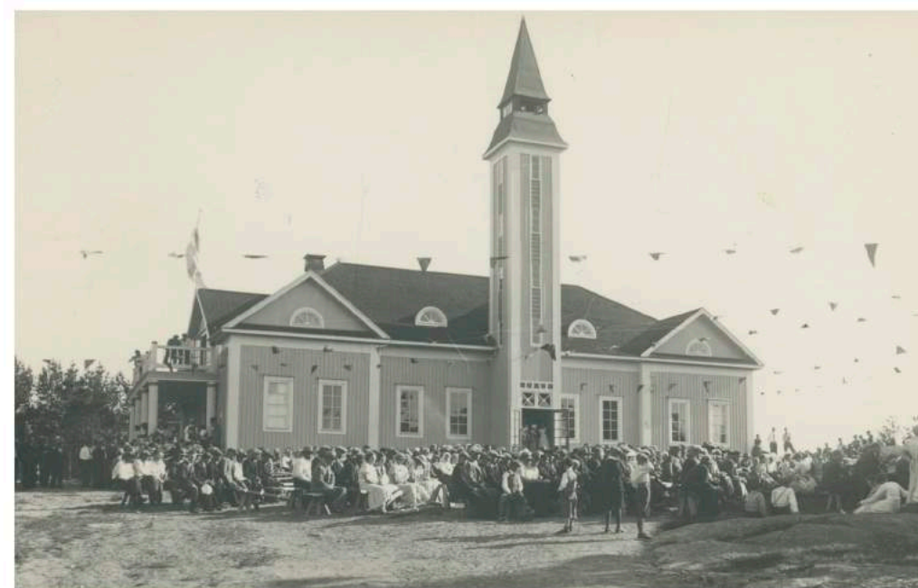
Den största gemensamma nämnaren för ungdomsföreningarna i Österbotten är föreningshusen. Lokalerna är ofta byggda på talko och fungerar som samlingsplatser för hela byn. På bilden från 1934 är det sångfest vid Rejpelt Uf.

Hoppas att materialet inspirerar, och att ni får många trevliga och intressanta stunder tillsammans. Lycka till, och ha det roligt!