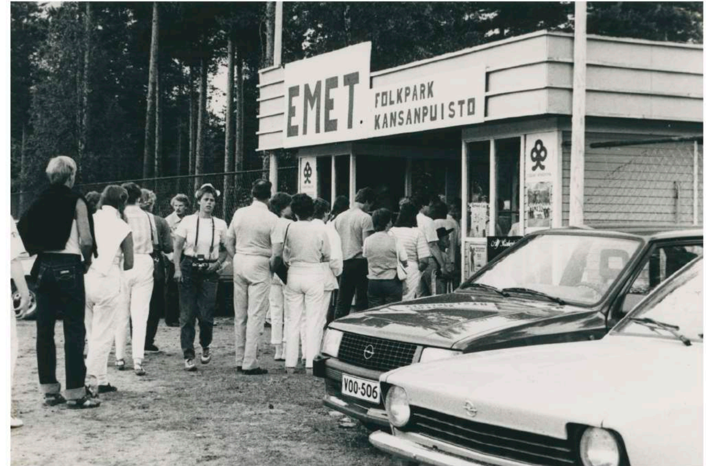
Från och med 1960-talet ordnades det dans flera gånger i veckan i de österbottniska föreningarna. Det var på dansen man träffade vänner och blivande partners. För musiken stod både lokala dansband och svenska popstjärnor som drog stor publik. Bild från Emet folkpark på 1980-talet.

Vilka band eller artister är populära i klassen? Skriv ner namn på band eller artister ni gillar på lappar (alla får skriva en egen/egna lappar, en artist per lapp). Samla ihop lapparna och se efter om någon artist finns med på flera lappar, eller om alla skrivit ner olika artister. Vilka olika musikgenrer finns representerade? Känner alla i klassen till de artister som nämns? Spela upp smakprov på de olika artisternas låtar i klassen och reflektera över hurdan musiksmak ni har. Fundera också på om artisterna ni räknat upp är lokala, eller om de kommer från något annat land. Har någon av er sett artisterna live? Berätta för varandra om konserter ni besökt och varför ni gillar en viss artist. Tänk bakåt i tiden: Vilka olika artister har varit stora under er uppväxt? Vad är det som gör att vissa artister blir populära vid en viss tidpunkt?