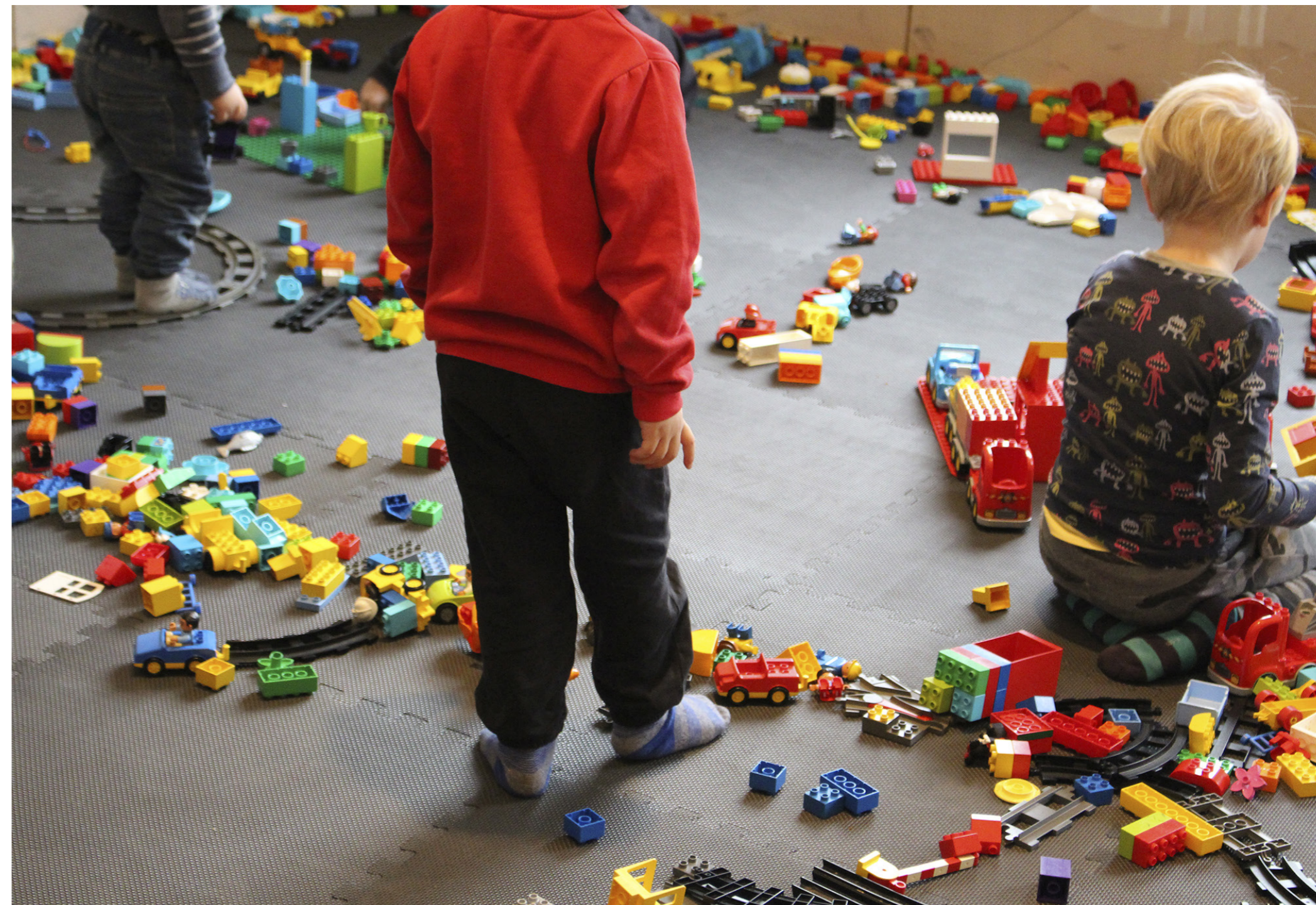
Barn får utlopp för sin kreativitet i samband med en makeridag i Jeppo UF. Under dagen kunde barn och unga göra allt från att bygga med lego till att testa 3D-printning och att klappa en levande orm.

Verksamhetsområdet finansierades främst genom: Stiftelsen Brita Maria Renlunds minne, Statsbidrag för ungdomsorganisationer, Svenska kulturfonden.