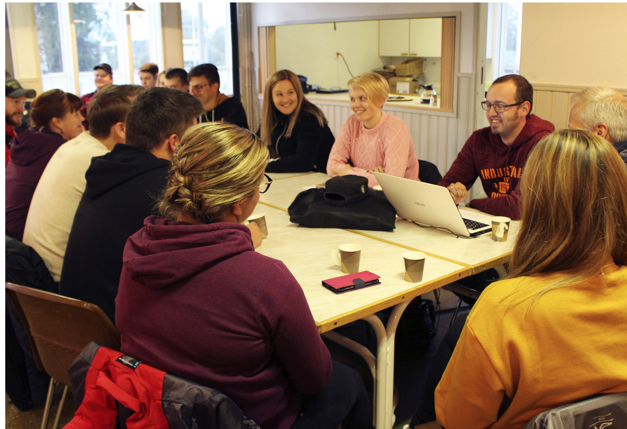
Foto till ÖP från ett reportage i Överesse UF. Föreningen är i färd med att spåna fram och skriva revytexter inför den stundande premiären. Föreningen har hållit en paus i revyverksamheten i fem år, men är nu på gång igen.

Verksamhetsområdet finansierades främst genom: Näringsliv/sponsorer, eget kapital.