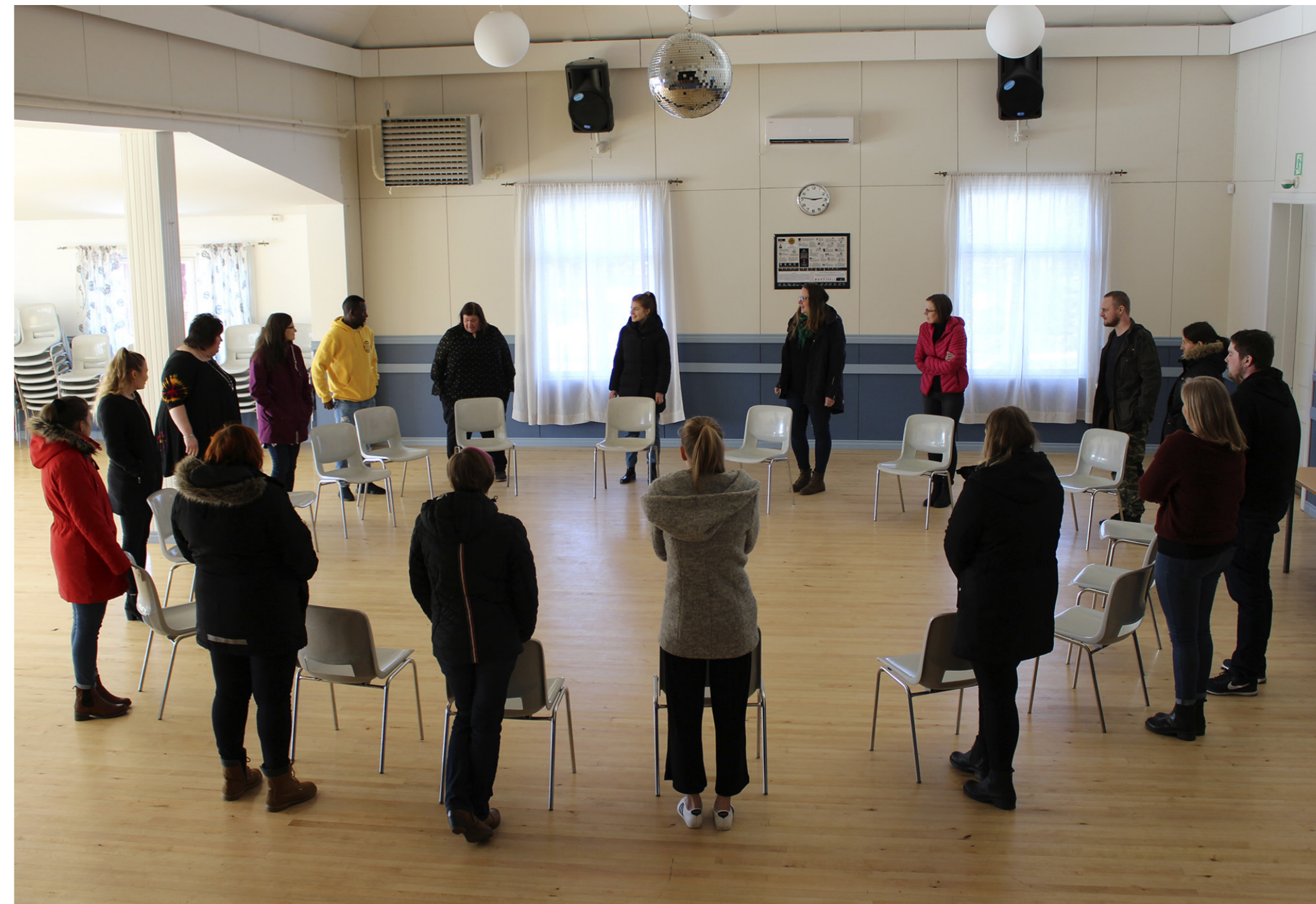
SÖU arrangerade en kursdag för utvecklande av barnverksamhet i föreningarna i samarbete med Folkhälsan. Kursen hölls i Solf UF i mars 2019.

Verksamhetsområdet finansierades främst genom: Statsbidrag för ungdomsorganisationer, Svenska kulturfonden, kursverksamhet tillsammans med SFV-Bildning.