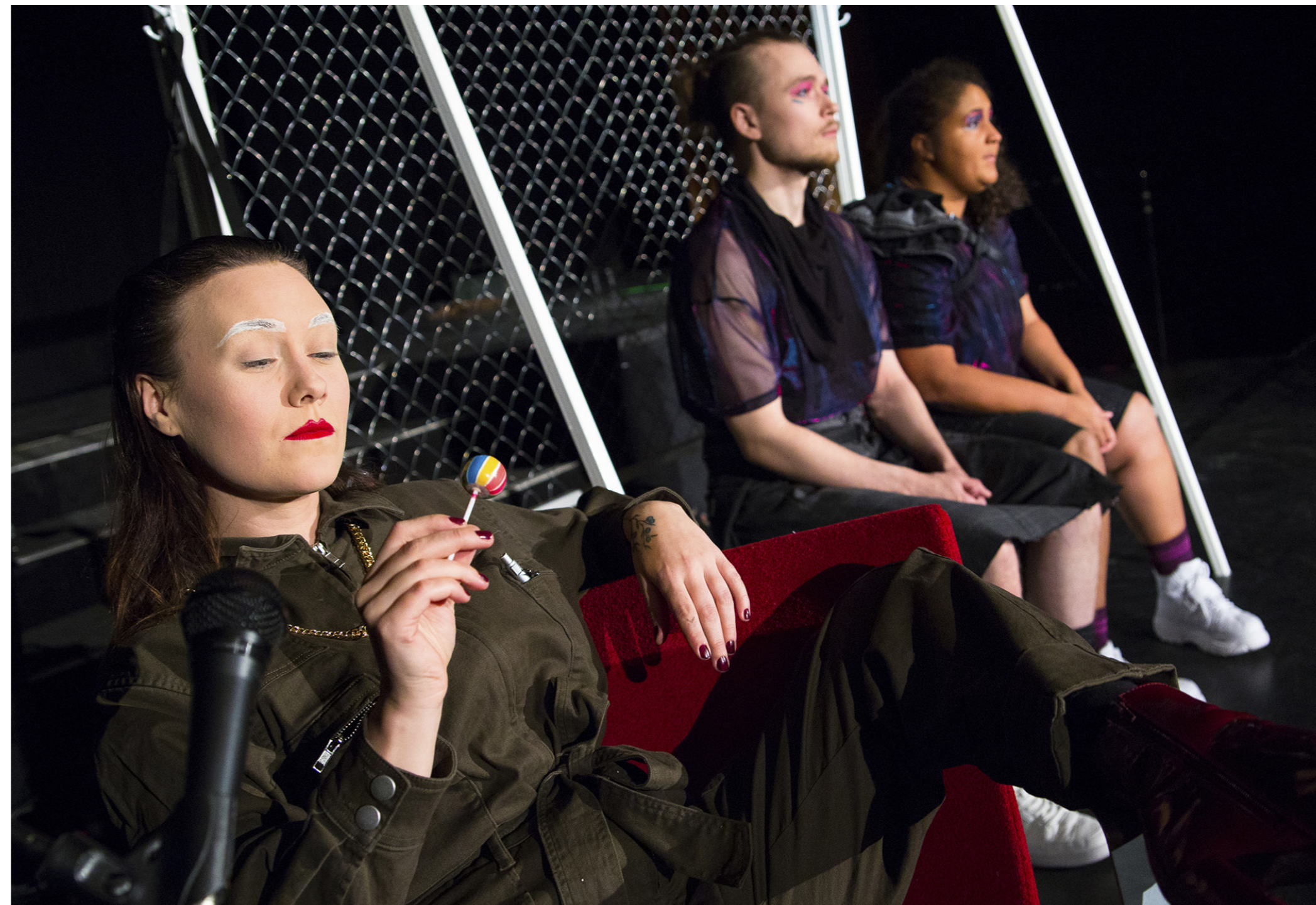
I produktionen "Toner från en trimmad förgasare" ger Unga scenkompaniet utrymme för ungdomars känslor och åsikter, manuset har producerats tillsammans med ungdomsgrupper i Österbotten.

Verksamhetsområdet finansierades främst genom: Statsbidrag för ungdomsorganisationer, Aktion Österbotten, Svenska kulturfonden, Svenska Folkskolans Vänner.