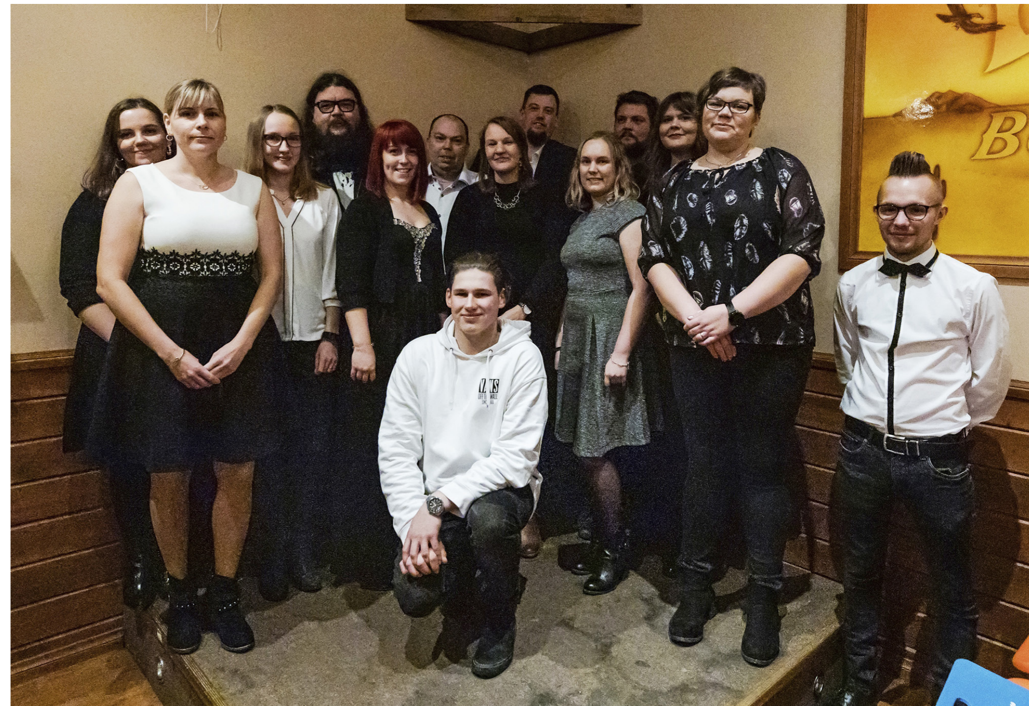
Delar av SÖU:s avgående och tillträdande styrelse och verksamhetsledaren i samband med höstmötet 2019 i Molpe.

Bokslutet för 2019 påvisar ett negativt resultat men likviditeten är fortfarande positiv. Dock bör en balansering eftersträvas och ett nollresultat uppnås under 2020–2021. Underskottets orsak är spårbar och beror främst på personalförändringar.