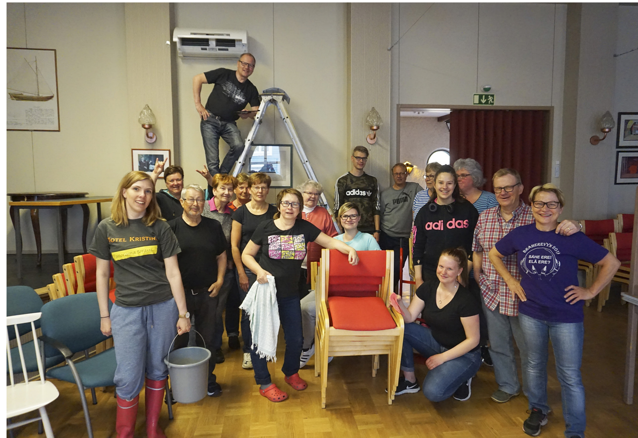
Svenska Föreningen Brahegården i Kristinestad var en av 30 föreningar som deltog i Den Stora Talkodagen den 25 maj 2019. Dagen samlade deltagare i alla åldrar som städade, målade och fixade till uteområden i hela Österbotten.

Verksamhetsområdet finansierades främst genom: Svenska kulturfonden.