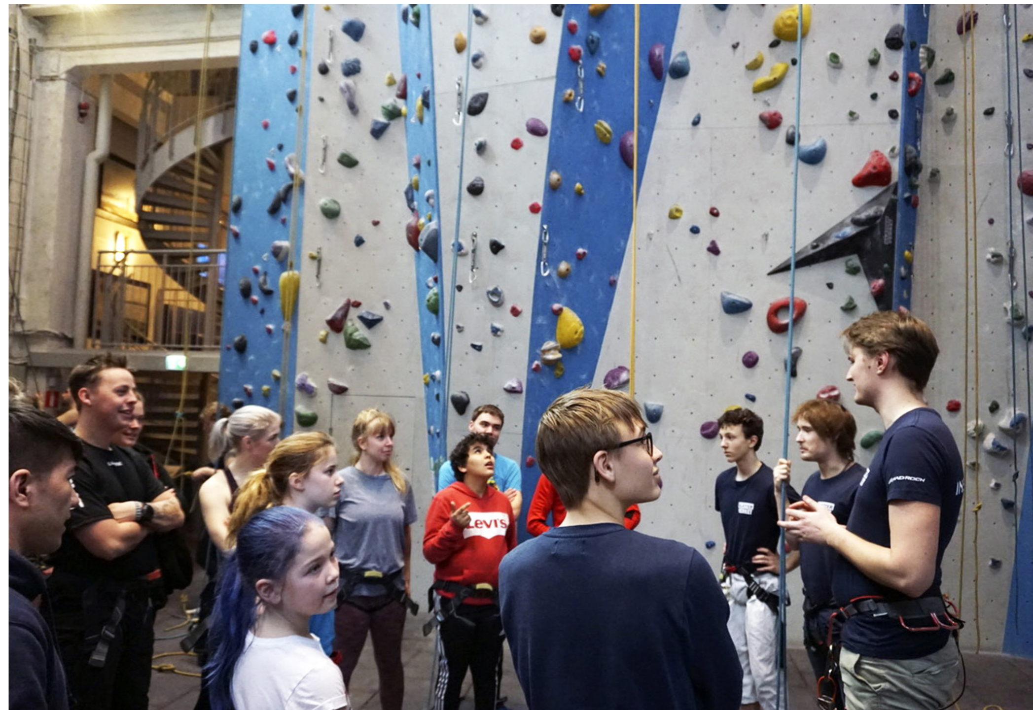
SÖU deltog i Bygdegårdsgårdarnas riksförbunds inspirationshelg på Tollare folkhögskola (Sverige) i mars 2019.

Verksamhetsområdet finansierades främst genom: Statsbidrag för ungdomsorganisationer, Svenska kulturfonden