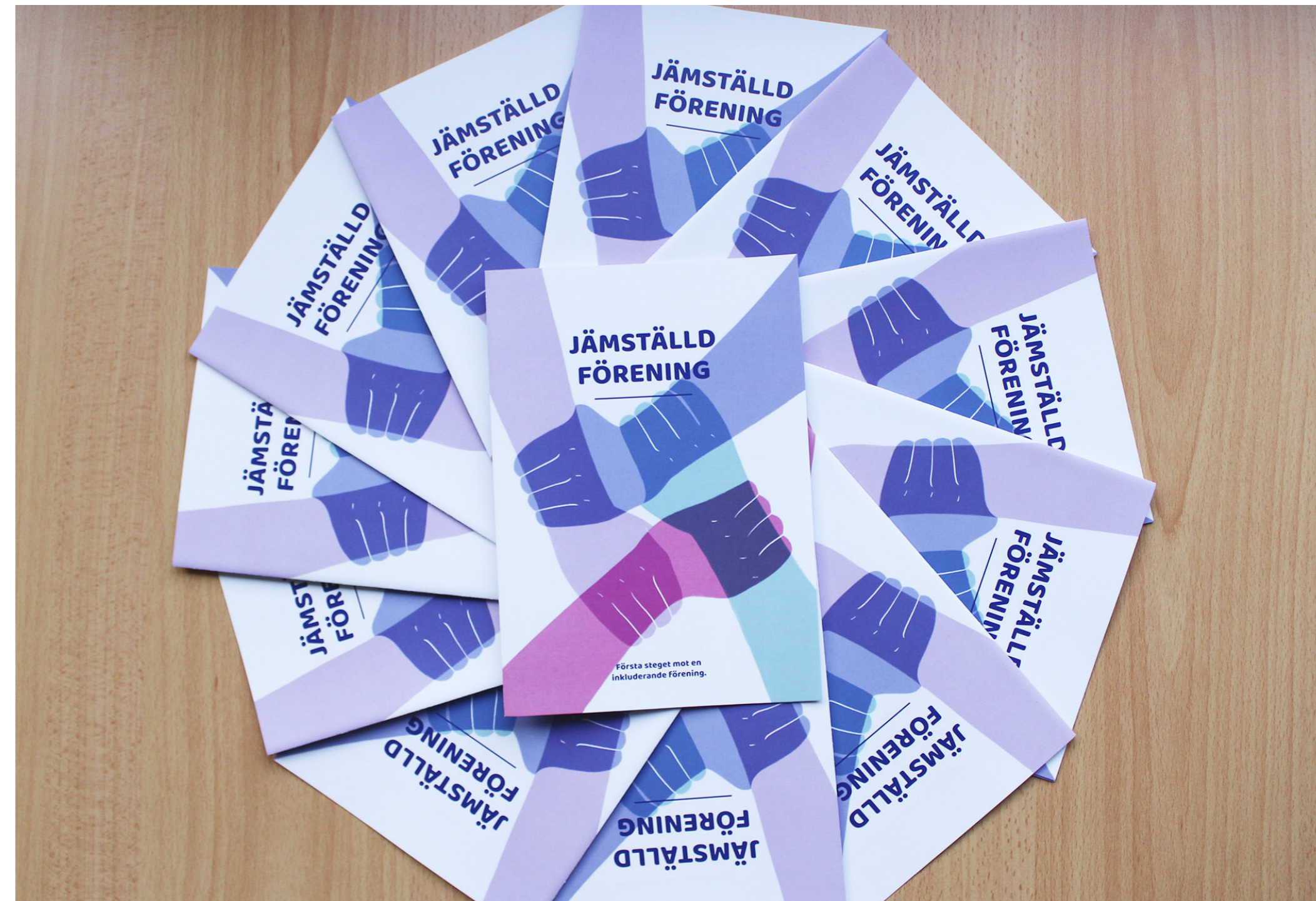
Under 2019 skapades broschyren "Jämställd förening" som distribuerades till föreningar och samarbetspartners som en del i SÖU:s kommunikation.

Verksamhetsområdet finansierades främst genom: Statsbidrag för ungdomsorganisationer, Svenska kulturfonden (inkl. det s.k förbundswebbpaketet)