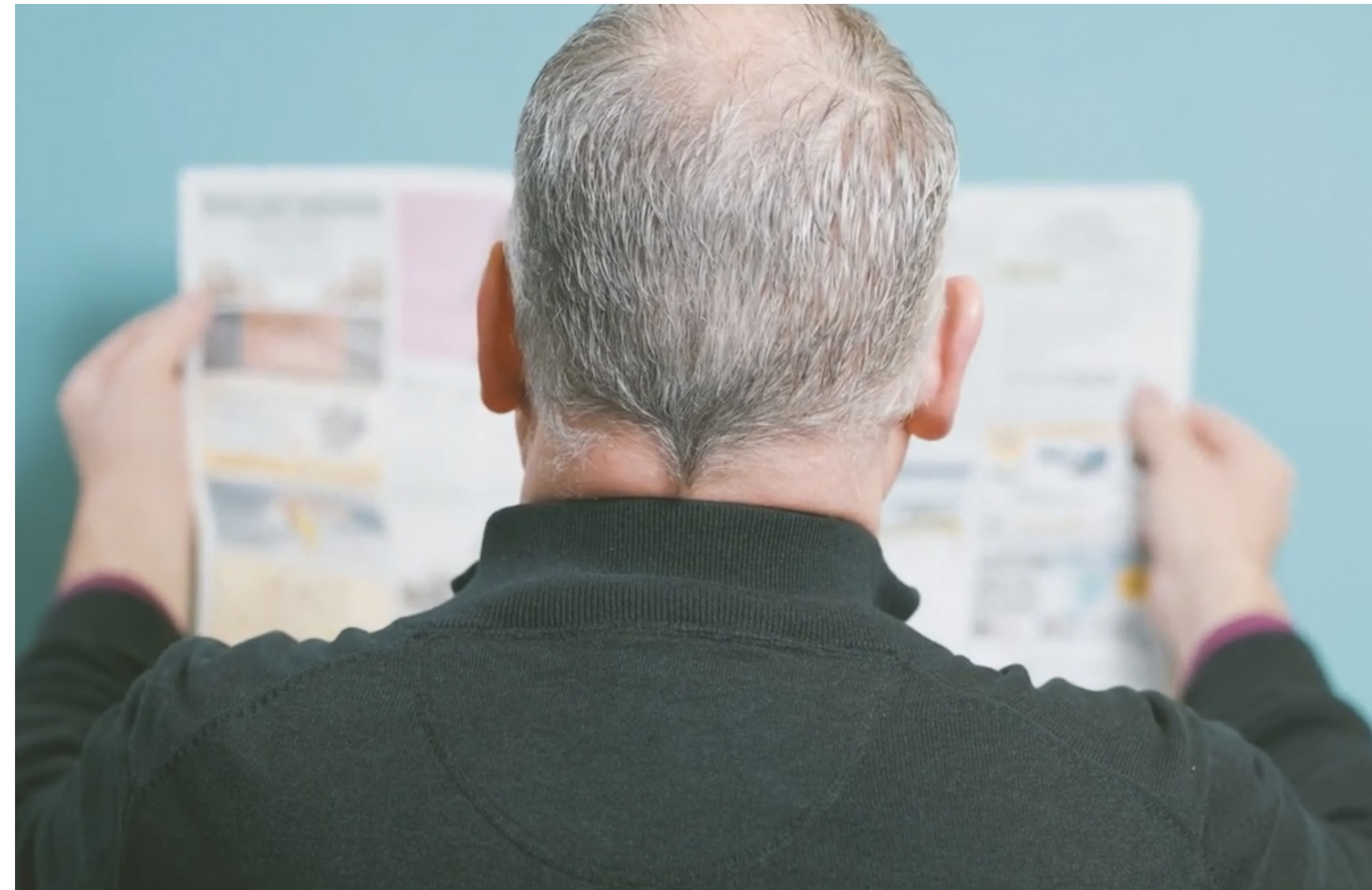
Biskop Bo-Göran Åstrand, österbottning i exil, läser gärna ÖP för att veta vad som händer i hemsoporna. Skärmlapp från Förbundsarenans tidskriftskampanj.

I slutet av året inleddes planeringen av en podd för att bredda ÖP:s verksamhet och premiär sker i mars 2021. Podden är tänkt att kunna lyfta upp profiler inom UF-rörelsen på ett djupare plan.