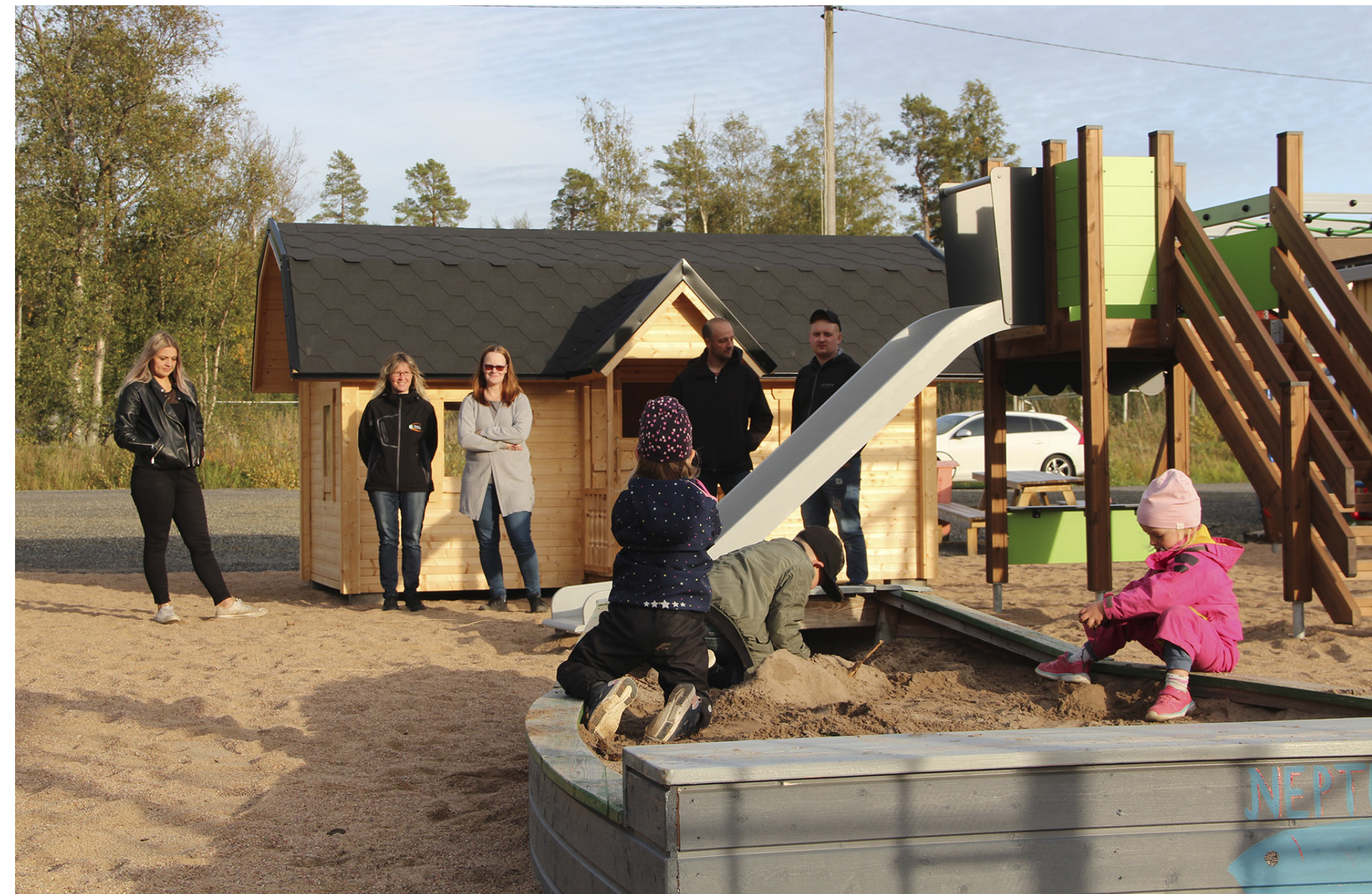
Barnverksamheten i föreningarna är viktig. På bilden Nämpnäs UF som 2020 fixade till en lekpark invid sin lokal.

Rådgivning kring barnläger, vad man kan ordna och med vilka begränsningar tog mycket tid i anspråk 2020. Glädjande nog ville föreningarna upprätthålla barnverksamhet så långt som möjligt trots rådande pandemi. SÖU fungerade som bollplank och inspiratör för många föreningar och bidrog till att aktiviteter arrangerades lokalt och även som stöd i bidragsansökningar.