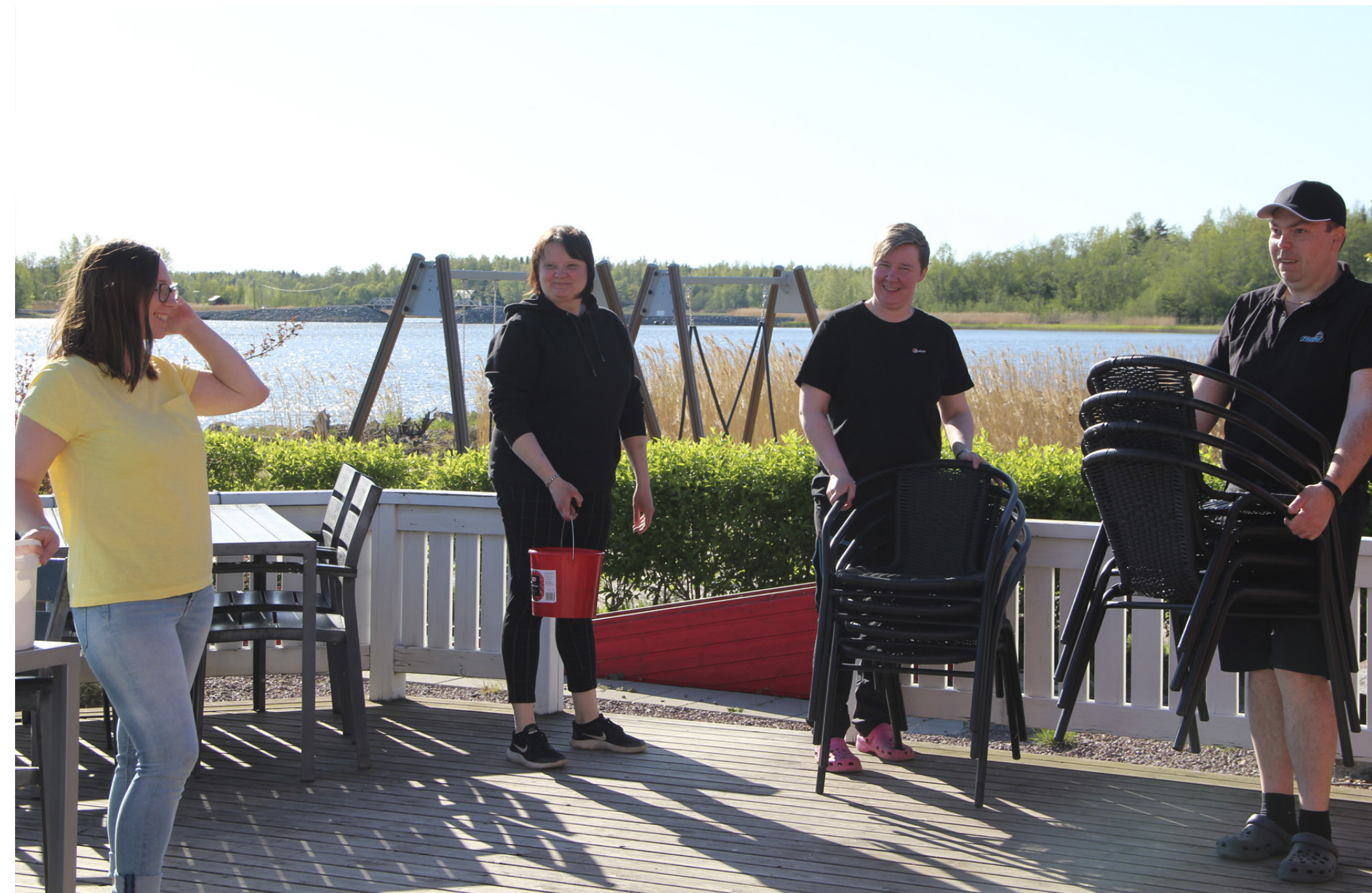
Informationsflödet var viktigt under året, speciellt för evenemangsarrangerande föreningar. På bilden ses Rangby UF fixa till terrassen vid restaurangen i Fagerö Folkpark, reportage i ÖP om förhoppningarna och farhågorna inför sommarsäsongen.

För SÖU:s eget informationsflöde upprätthölls en sida på Facebook och Instagram, den egna hemsidan samt digitala utskick, den så kallade föreningsposten. Föreningsposten skickades ut två gånger i månaden med aktuell info om verksamhet, kurser, olika bidrag med mera. Därtill figurerade SÖU flitigt i dagspressen, främst gällande föreningarnas situation under pandemin.