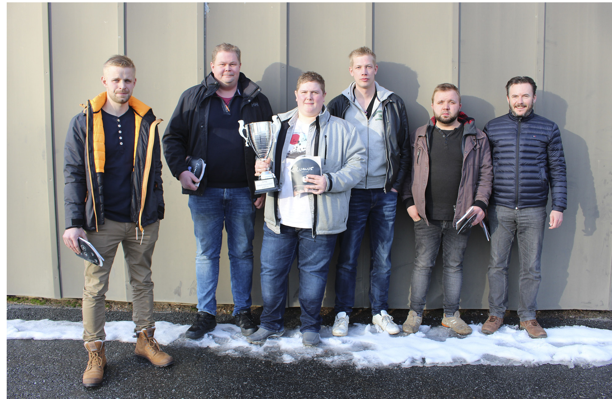
Pidrotturneringen 2019-2020 avslutades med final i mars 2020. Som segrare bland närmare 40 lag och över 300 deltagare stod Petalax UF.