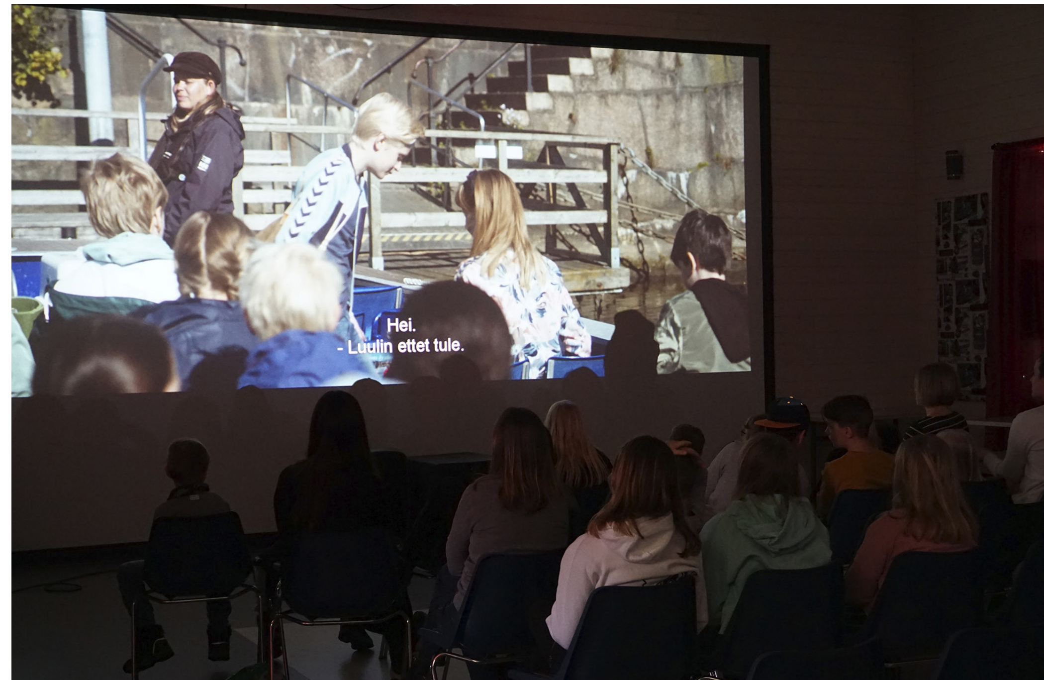
Kulturverksamheten bestod främst av kurser och nätverksträffar 2020 fram om konkreta evenemang. SÖU:s mobila biograf hann dock turnera under årets första tre månader i ett nytt lyckat samarbete med Filmcentrum Botnia.

Eftersom fysisk verksamhet inte kunde hållas gjordes en extra satsning på kurser online riktade till kulturaktörer. Vår viktigaste roll för kulturföreningarna 2020 var att fungera som informatör och påverkare, kontakten med myndigheter, press och föreningar var stor och regelbunden. De få evenemang som kunde arrangeras i föreningarna kändes extra viktiga att lyfta upp.