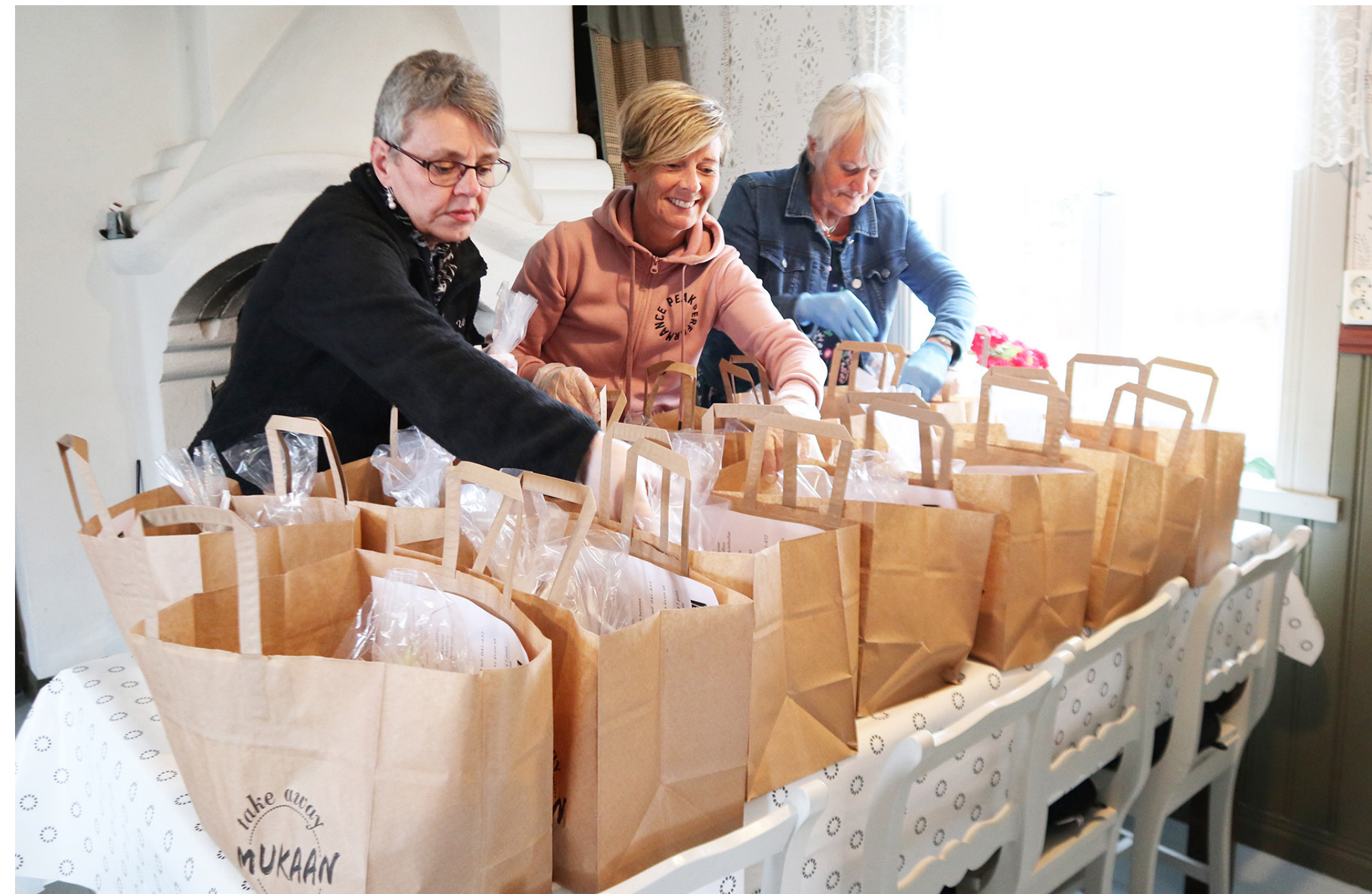
Nya sätt att få inkomster krävdes i föreningarna 2020. På bilden ses Pedersöre UF packa take away-kassar med bröd till morsdag, till midsommar sålde föreningen hemstekta köttbular med mera enligt samma system. Efterfrågan var stor.

En viktig uppgift under året var även att fungera som språkrör och lyfta medlemmarnas situation mot press, finansärer och beslutsfattare.