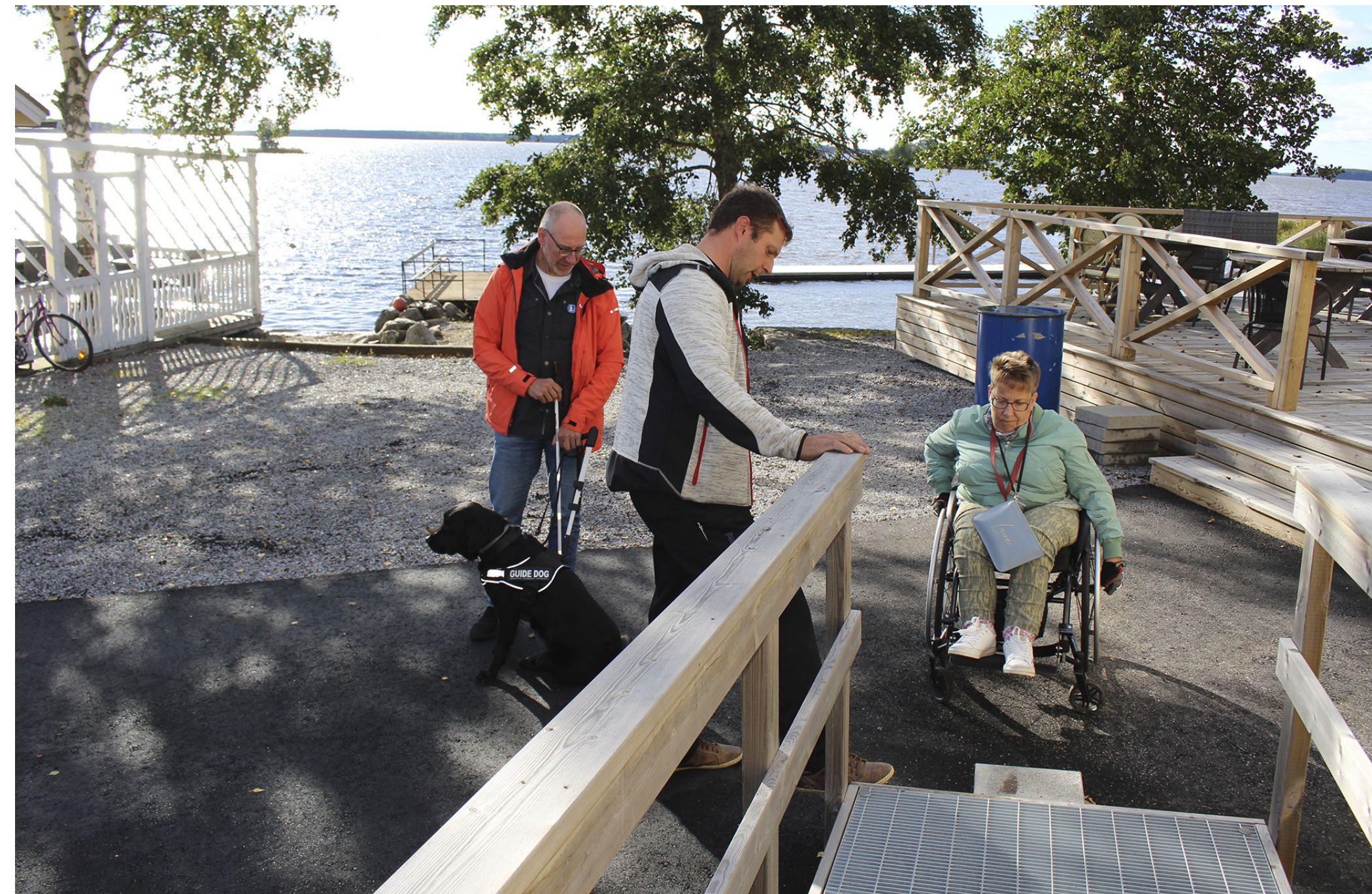
En del av arbetet med jämställdhet, demokrati och inkludering är tillgänglighet. På bilden erfarenhetsexperter på besök i Åminne Folkpark för att påvisa behov och vad föreningarna bör tänka på.

Precis som tidigare år sattes verksamhetsplan och budget ut för påverkan och kommentarer från fältet innan höstmötet. I hörandet fanns möjligheter till allmänna kommentarer och inkomna åsikter har behandlats i SÖU:s styrelse. Styrelsen har aktivt arbetat med att öka fältkontakter och transparens för att ytterligare involvera medlemskåren i beslutsprocesserna. Detta ledde bland annat konkret till att ringvisa Facebookgrupper startats upp där ordförande från varje förening med låg tröskel kan dryfta ärenden med andra föreningar och deras representant i styrelsen. Ingen från SÖU:s personal ingår, tanken är att även förbundet ska kunna kritiserars fritt i dessa grupper, kritik som i sin tur ska leda till utveckling av verksamheten.